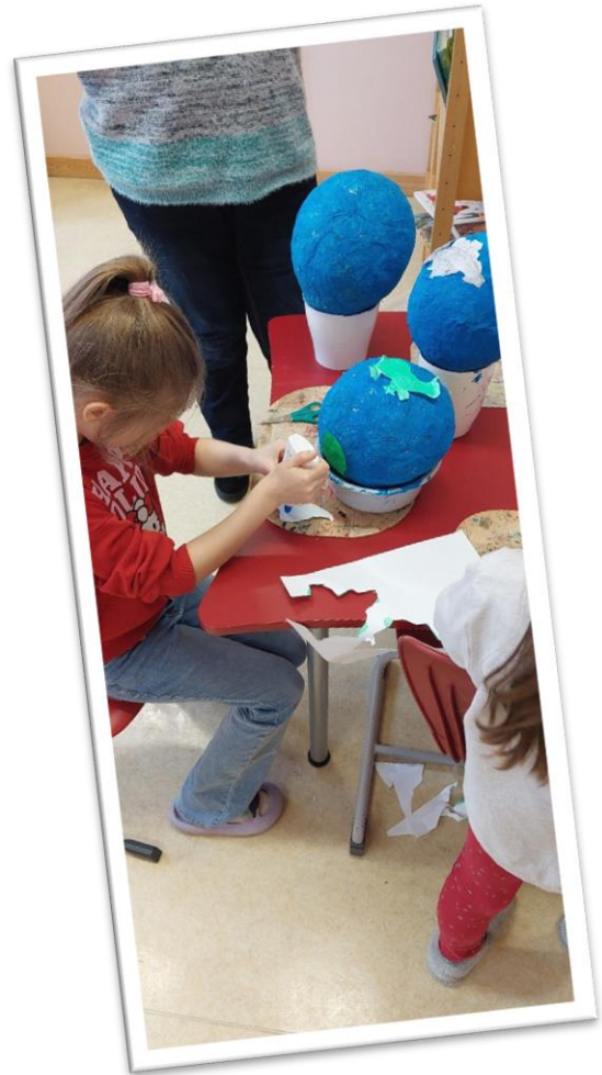
Herstellen von Weltkugeln aus Pappmaché