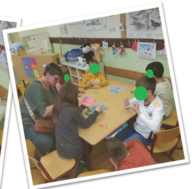
Herstellen von Ketten, Armbändern und Ringen aus Loombändern