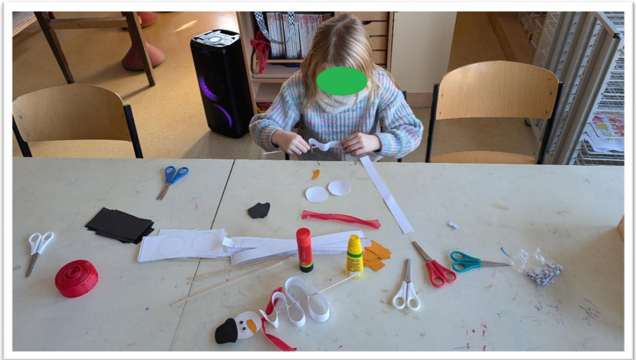
Schneemänner am Stiel basteln